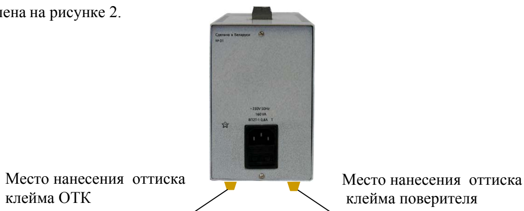
Рисунок 2 – Место нанесения оттиска клейма поверителя и оттиска клейма ОТК (вид источника питания сзади)

1.5.3 Схема пломбирования источника питания от несанкционированного доступа с указанием мест нанесения оттиска клейма ОТК и клейма государственного поверителя представлена на рисунке 2.