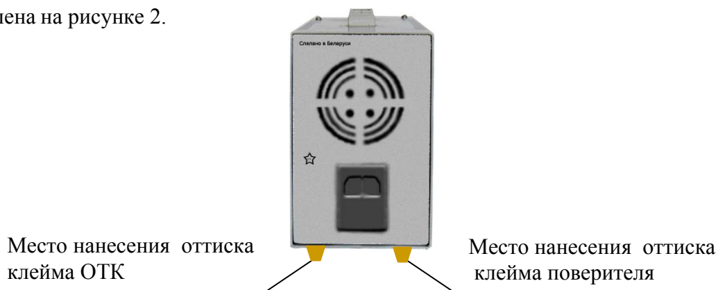
Рисунок 2 – Место нанесения оттиска клейма поверителя и оттиска клейма ОТК (вид источника питания сзади)

1.5.3 Схема пломбирования источника питания от несанкционированного доступа с указанием мест нанесения оттиска клейма ОТК и клейма государственного поверителя представлена на рисунке 2.